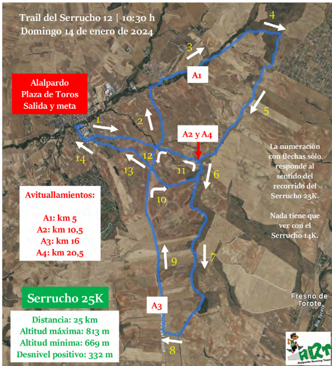
Track del Serrucho 25K

Serrucho 25K | Se adjunta imagen del recorrido y gráfico del desnivel